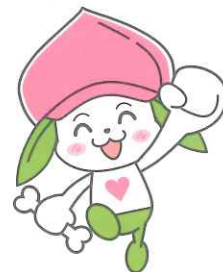
協会けんぽ福島支部マスコットキャラクター ケンタくん